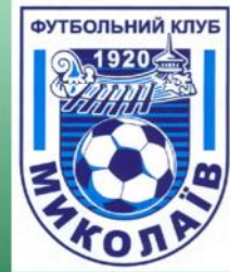
МФК “НИКОЛАЕВ” (Николаев)

10 октября, 2011 (понедельник) Алчевск, стадион «Сталь»